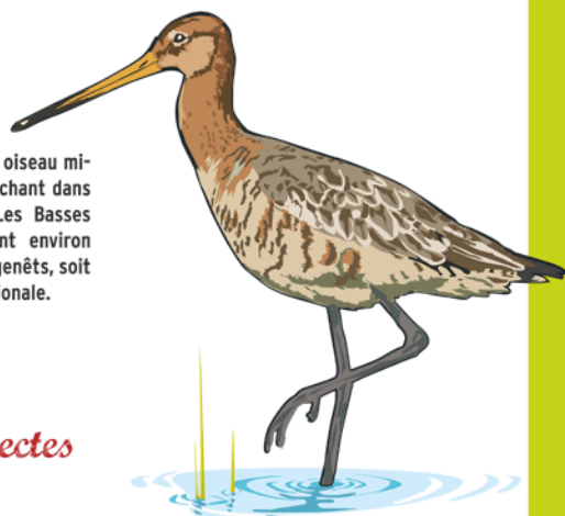
Barge à queue noire

Le Râle des genêts est un oiseau migrateur rare et protégé nichant dans les prairies inondables. Les Basses Vallées Angevines abritent environ 300 couples de Râles des genêts, soit 40 % de la population nationale.