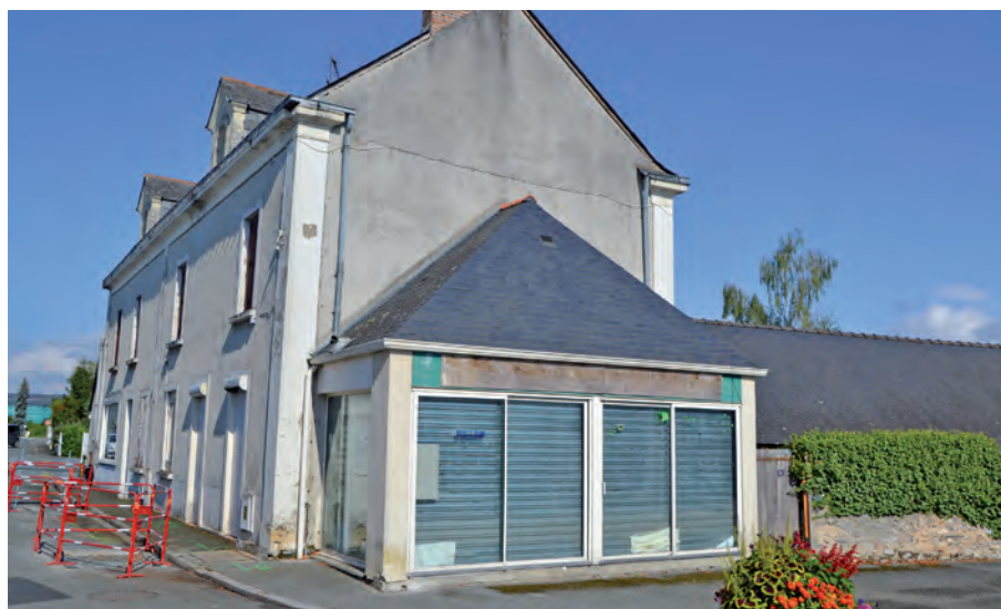
Ancien bar-tabac dont une partie va être démolie

Après en avoir délibéré, à l'unanimité, le Conseil municipal approuve le projet de démolition de bâtiments situés au 8 et 10 rue de Bellebranche et de végétalisation de la zone et autorise le Maire à solliciter une subvention d'aide aux travaux auprès de la DRAC.