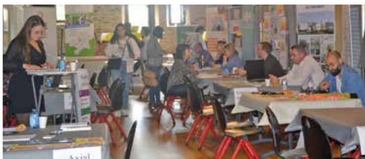
AVRIL : Forum job