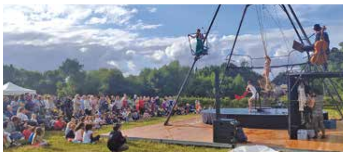
JUIN : Fête de l'été « Le rêve d'Erica »