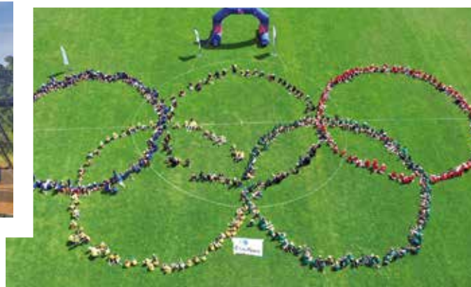
JUIN : Journée olympique pour les écoles de la ville