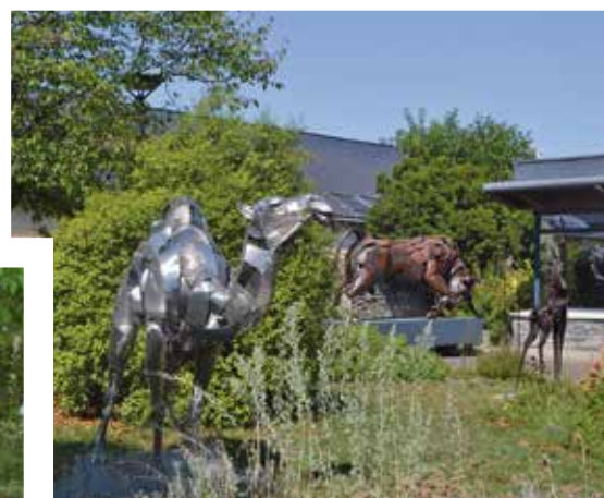
JUIN : Expositions des oeuvres de Gari dans le jardin des 5 sens à la mairie