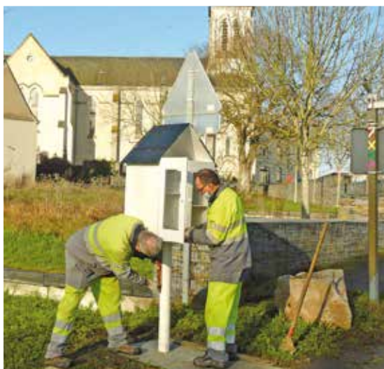
JANVIER : Installation des boîtes à livres sur la commune