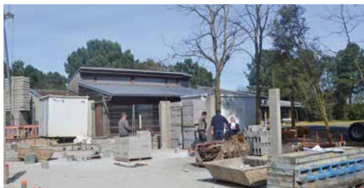
MARS : Travaux d'agrandissement centre de Loisirs