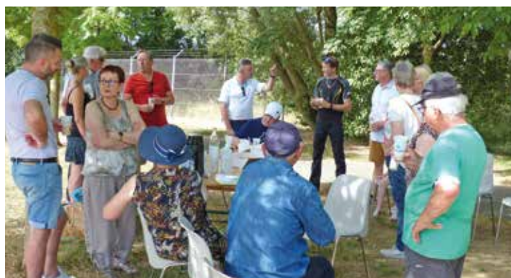
JUIN : Rencontre de quartier